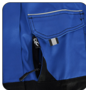
skrytá náprsní kapsa hidden chest pocket ukryta kieszeń na piersi